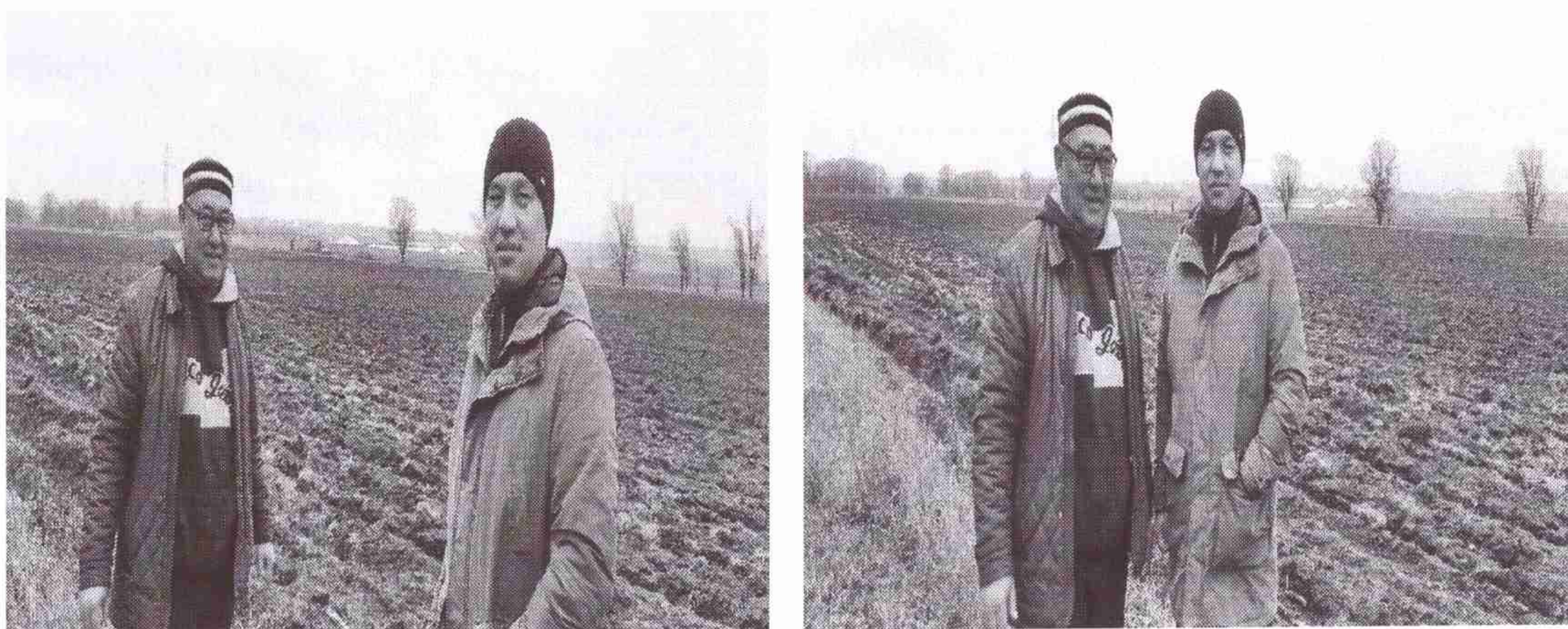
Рисунок 1- с руководителем хозяйства «Калижан»