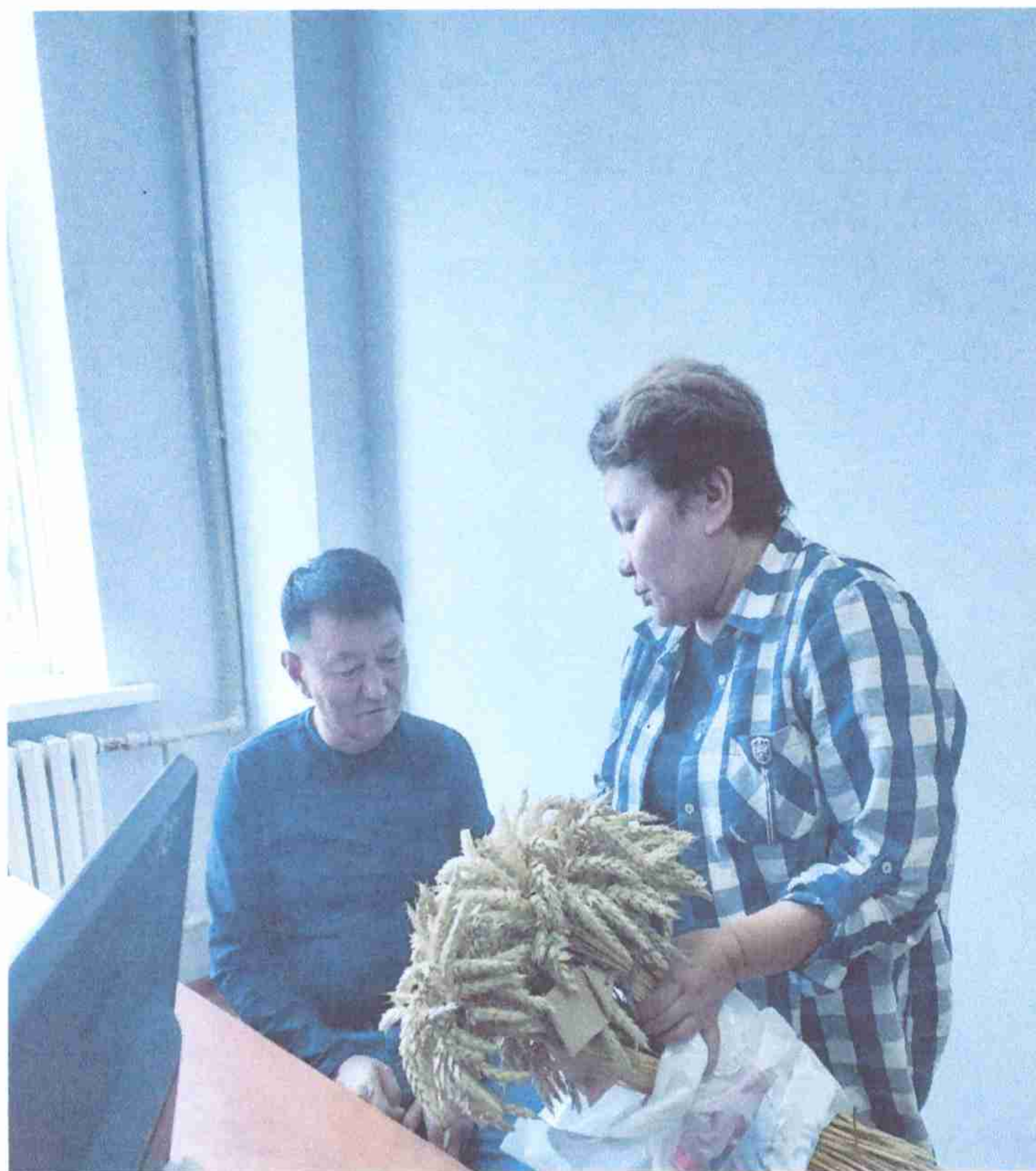
TOO «Sairambek Agro»