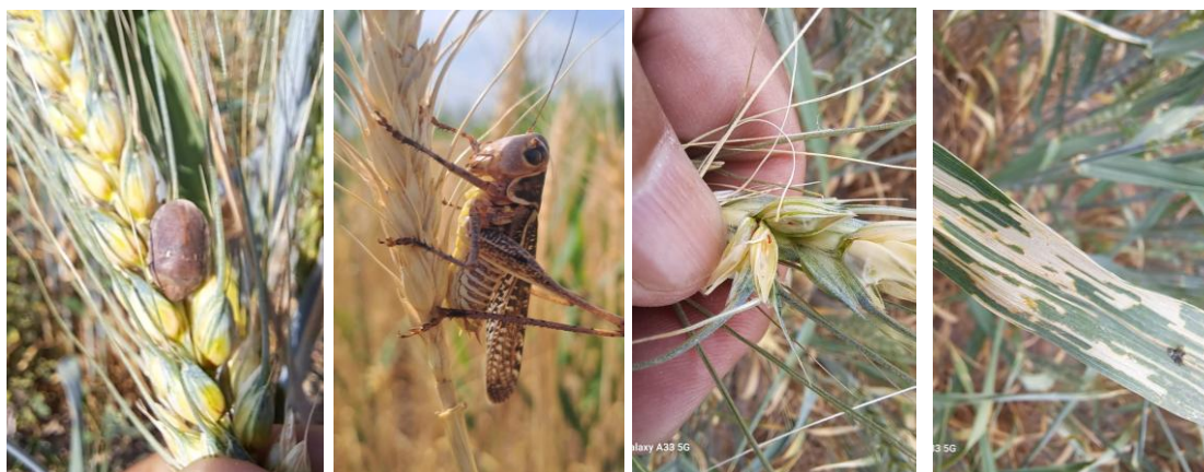
Рисунок 3 – Вредители на посевах озимой пшеницы – Клоп вредная черепашка, саранча, трипс, пьявица.