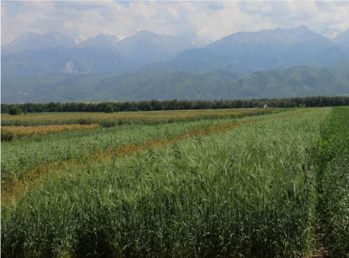
Сидеральное поле органического стационара ТОО «КазНИИЗиР».

Накопление азота в почве при воздействии бобовых культур (в кг на 1 га)