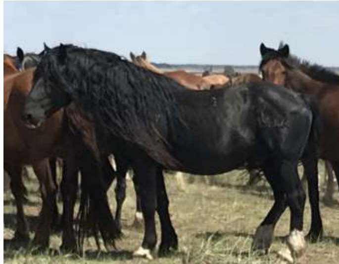
Сурет 3 – Шойынқара аталық ізін жалғастырушы қара айғыр Шомбал, тірі салмағы 507 кг.

Шойынқара аталық ізінің барлық жылқылары жыл бойы жайылымдық-тебендік ұстау жағдайларына бейімділігі үшін 8-9 балға ие. Олар жылдың барлық маусым-мезгілінде жақсы қонымдылықта болады. Айғырлар жоғары тұқымдылығымен ерекшеленеді, үйіріндегі биелері 90-95% құлындайды.