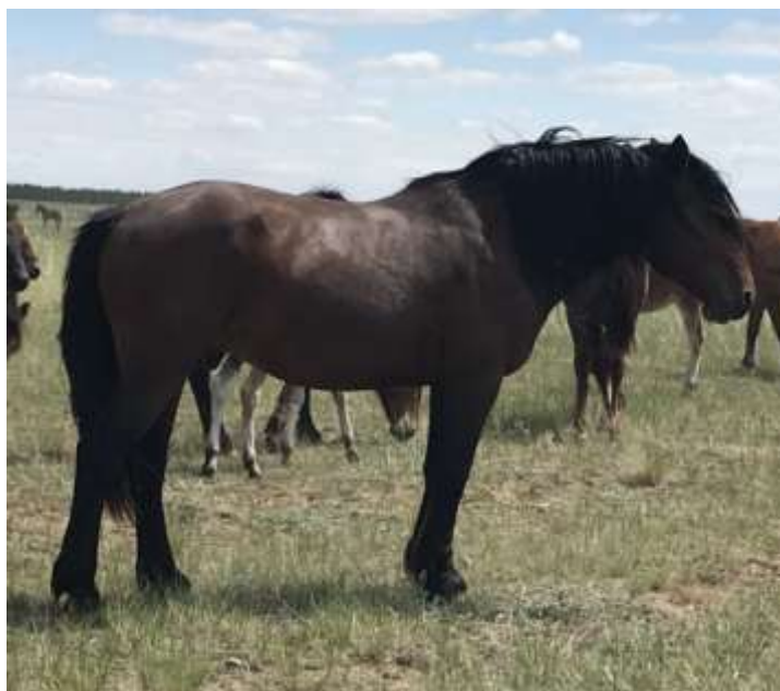
Сурет 1 – Байторы аталық ізінің жалғастырушысы торы айғыр Белес, тірі салмағы 512 кг.

Байторы аталық ізінің биелері-бұл жоғары сүт жылқылар, олардың орташа тәуліктік сүті 14,30 литр, ал лактацияның 105 күніндегі сүт мөлшері 1501,50 литр [8,9].