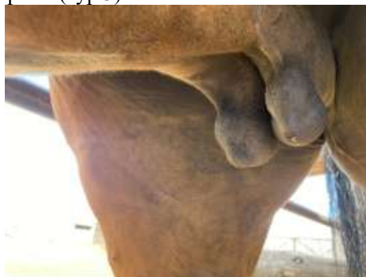
Сурет 1 – Шойынқара аталық ізі биелерінің желіні мен емі.

Шойынқара аталық ізі жылқыларына тән: орташа бас, мойны ұзын бұлшық етті жақсы жетілген, арқасы ұзын түзу, қақпан бел, тұлғасы шомбал, саурыны түсінкі жалпақ, сүйекті, аяқтары күшті. (сур.3).