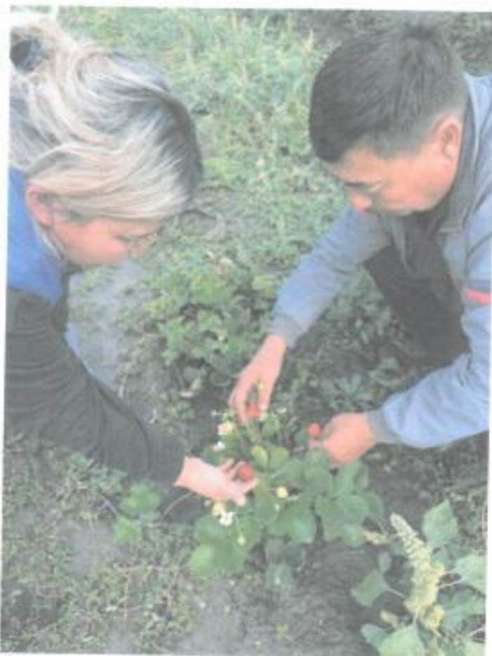
Оценка ягод новых сортов земляники