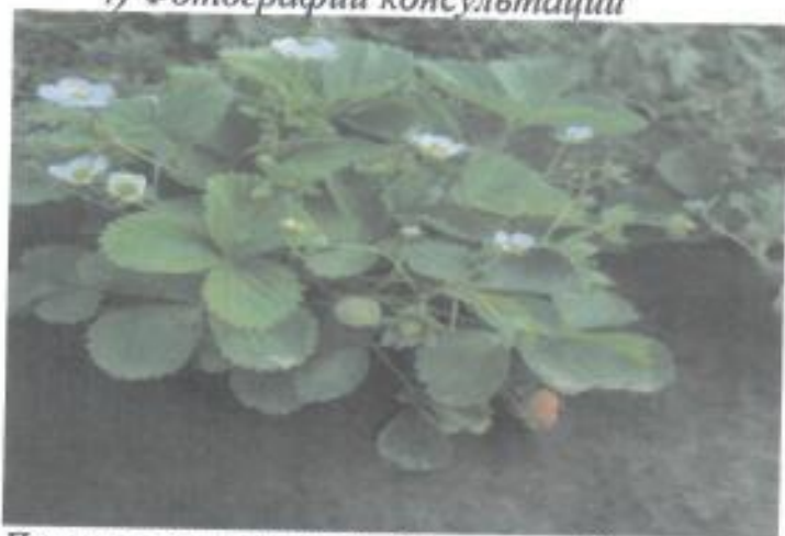
Перспективный сорт для Восточного Казахстана земляники Флорида Бьюти