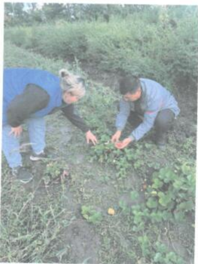
Проведение консультации в к/х «Нур-Береке»