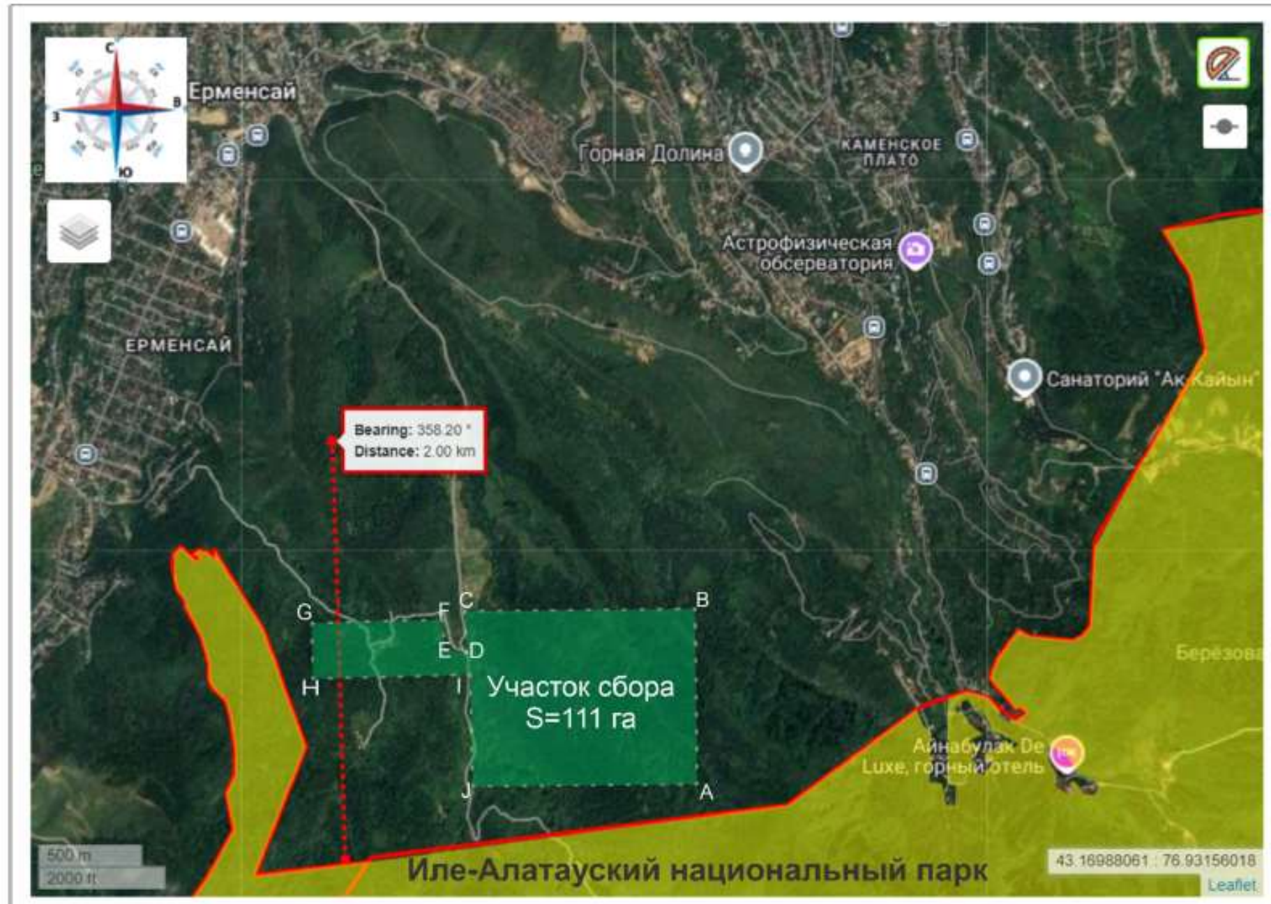
Приложение - 1: Карта-схема расположения участка для сбора дикорастущего органического сырья.