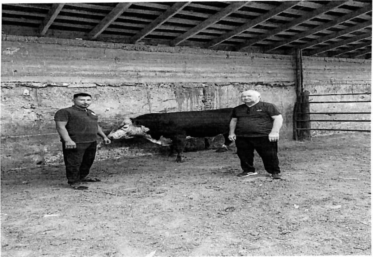
Осмотр животных на базе хозяйства