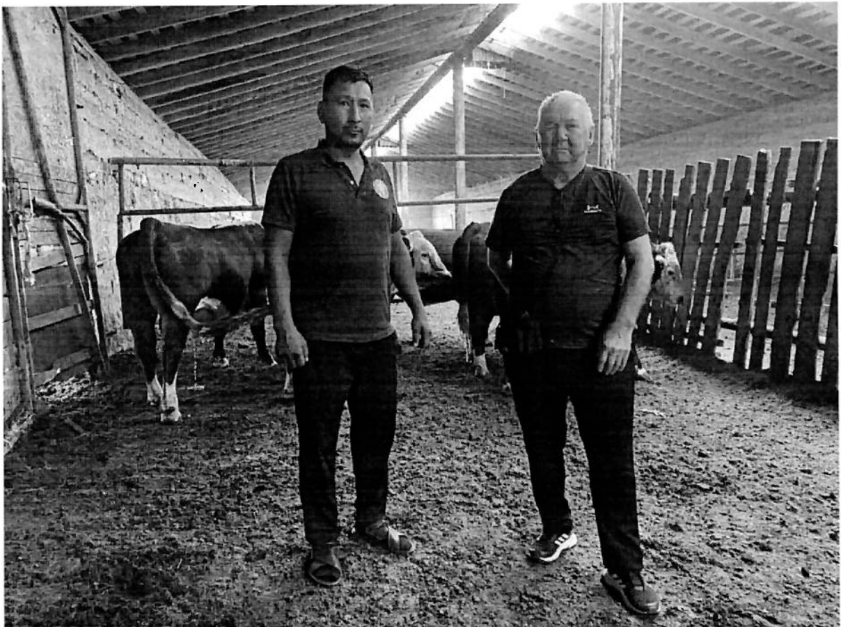
Консультация в хозяйстве со специалистом