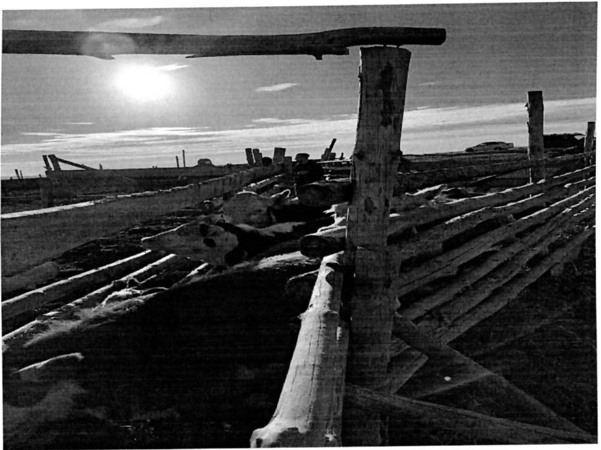
Осмотр животных на базе хозяйства